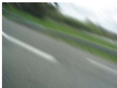
En route vers le mangeur de cigogne

Me voilà prêt. J'ai embrassé Sylvain le chat, dernier être vivant daignant supporter ma présence, et pars jusqu'au 15 juin prochain. Je vous tiendrai régulièrement au courant de mes aventures sur la recherche du mangeur de cigogne , restez connectés sur NONAME.FR !